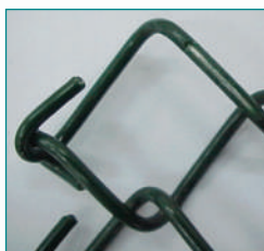
Medição de tela de alambrado (simples torção) segundo definição da ABNT.