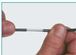
Teste do canivete.

No arame Alta Aderência o PVC não se solta do arame quando cortado, já no arame revestido comum o revestimento é arrancado totalmente.